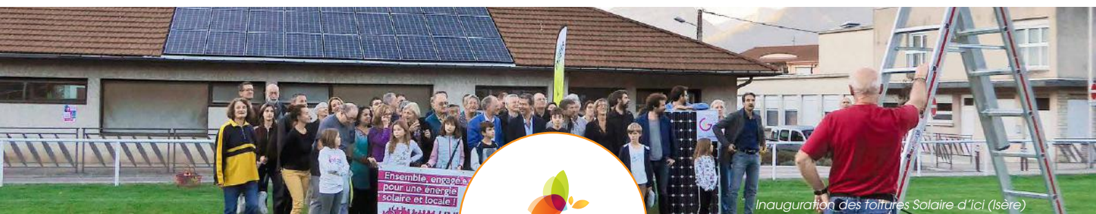
Inauguration des toitures Solaire d'ici (Isère)

https://energie-partagee.org/etude-retombees-eco