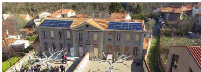
Mairie de Taurinya (66) équipée par Conflent Énergie.

D'où l'importance d'encourager les investisseurs citoyens à venir rapidement et à rester sur le long terme au capital des projets.